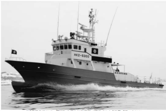
約5億円を投じて、岸野町の運上船舶工業で建造された2代目「ほっかい」