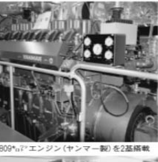
出力800馬力のエンジン（ヤンマー製）を2基搭載