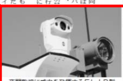
夜間監視に威力を発揮するFLIR製の暗視カメラVOYAGER III