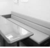
最低5人でも動かせられる船