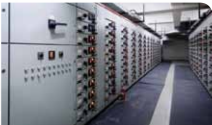
重要機器の継続的モニタリング

AX8は赤外線カメラと可視光デジタルカメラを搭載しながら、54×25×95mmのコンパクト設計で、スペースが限られた場所でも簡単に設置でき、重要電気機器や機械設備などを稼働したままで継続的に温度をモニタリングします。